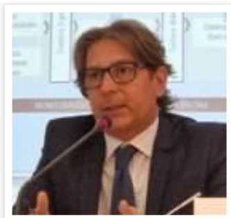
Salvo Inglima Segretario Nazionale CISL Scuola